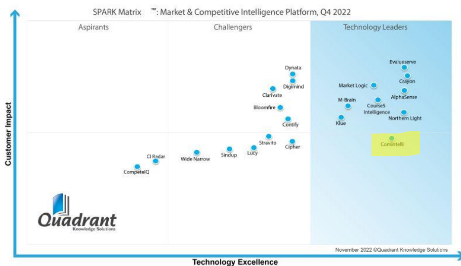
BILD: Comintelli räknas som globalt ledande teknikleverantör av Quadrant