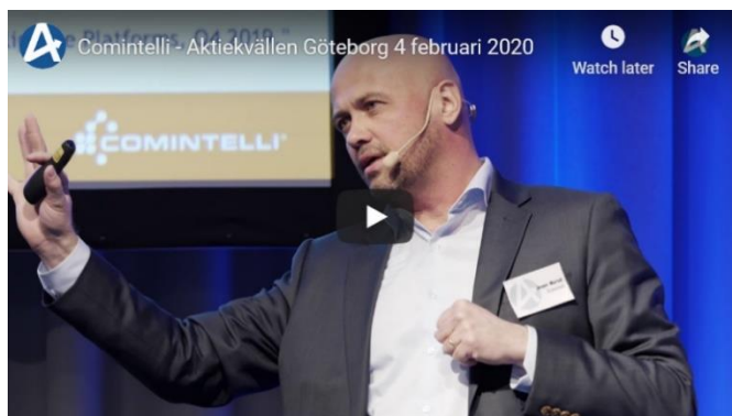
Comintelli presenterar på Aktiespararnas SaaS kväll.